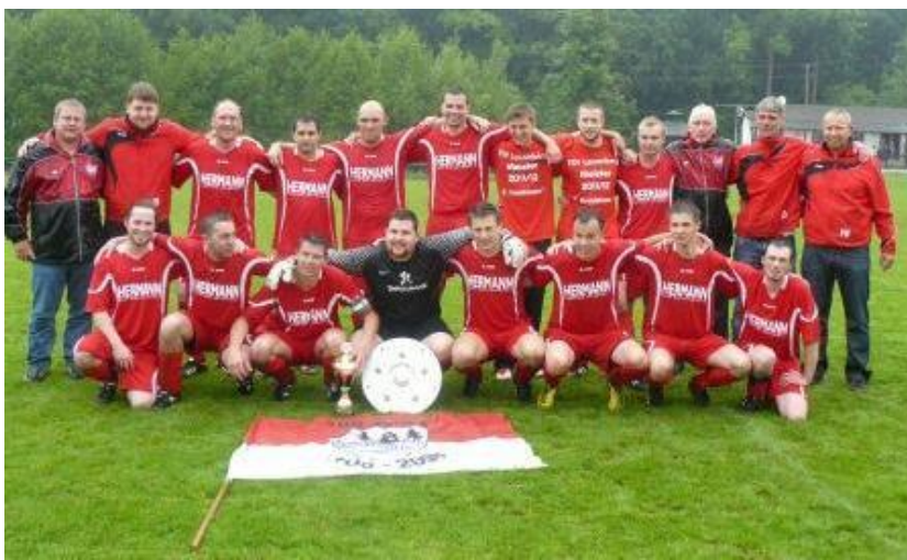
Die Meister-Elf nach dem letzten Spiel in Bishausen.

Große Freude gab es im Sommer 2012 auch bei den Spielern der 1. Fußballherrenmannschaft, die sich mit einem 12:1 Sieg am letzten Spieltag in Bishausen die Meisterschaft in der 2. Kreisklasse I sicherten und somit in die 1. Kreisklasse aufstiegen.